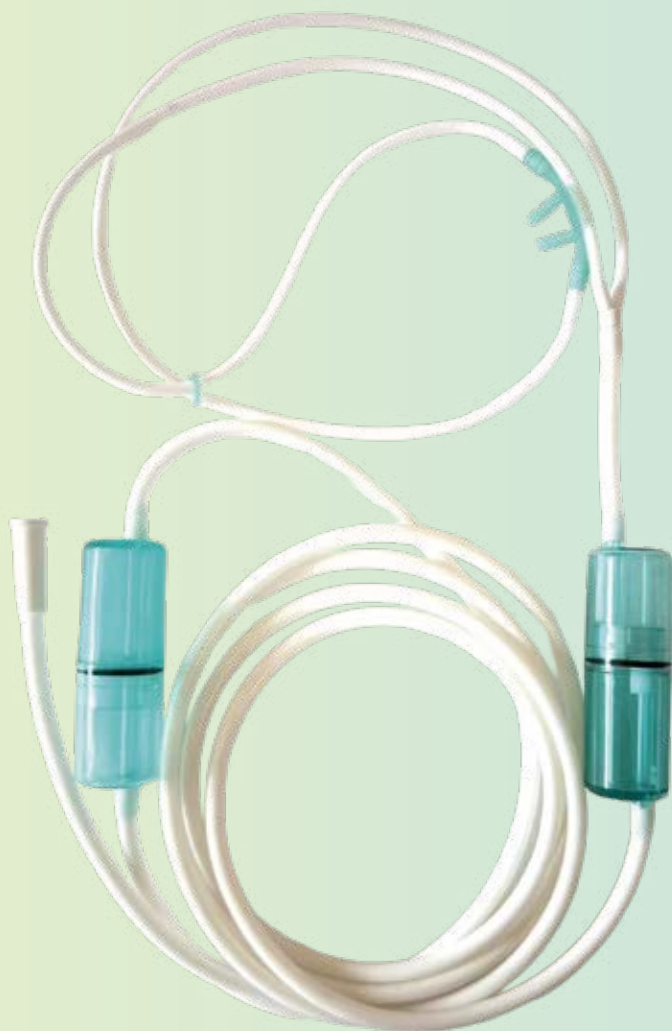
水止めカニューラ WATER LESS