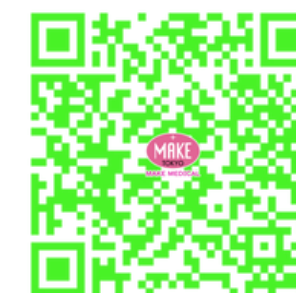
安全にお使いいただくために

https://drive.google.com/drive/folders/1UYM6_IBR9r3zHtNmCvKhFw9RLpVqt8fH?usp=drive_link