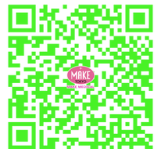
水素吸入器の選び方

https://drive.google.com/drive/folders/1UYM6_IBR9r3zHtNmCvKhFw9RLpVqt8fH?usp=drive_link