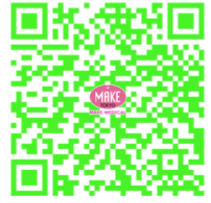
レンタルのご案内

https://drive.google.com/drive/folders/1UYM6_IBR9r3zHtNmCvKhFw9RLpVqt8fH?usp=drive_link