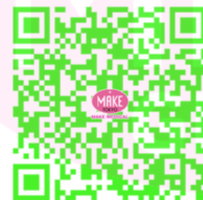
医療機関向け情報誌

https://drive.google.com/drive/folders/1UYM6_IBR9r3zHtNmCvKhFw9RLpVqt8fH?usp=drive_link