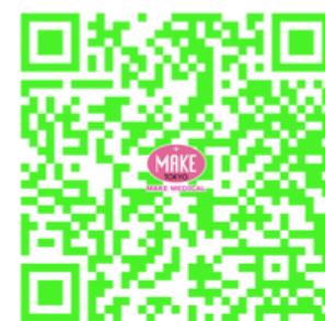
水素濃度測定レポート

https://drive.google.com/drive/folders/1UYM6_IBR9r3zHtNmCvKhFw9RLpVqt8fH?usp=drive_link