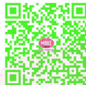
水素のもつパワー

https://drive.google.com/drive/folders/1UYM6_IBR9r3zHtNmCvKhFw9RLpVqt8fH?usp=drive_link